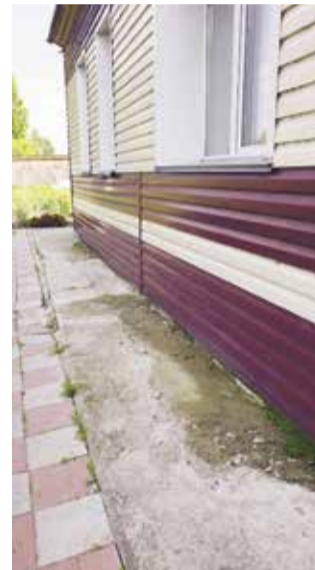
НА ФОТО: БЕЗ ВОДООТВОДА ОТМОСТКА ДОМА ВЕТЕРАНОВ ПРАКТИЧЕСКИ ПЕРЕСТАЛА СУЩЕСТВОВАТЬ

Но при этом даже у самой возрастной категории верх-каргатцев есть свое приусадебное хозяйство, поэтому на встрече люди просили коммунистов организовать либо систему погребов, либо овощехранилище.